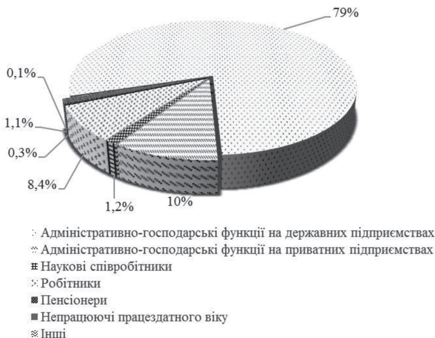
Графічне зображення структури злочинців в ОПК за особливостями правового статусу у сфері трудових відносин (узагальнені дані за 2013–2020 рр.)